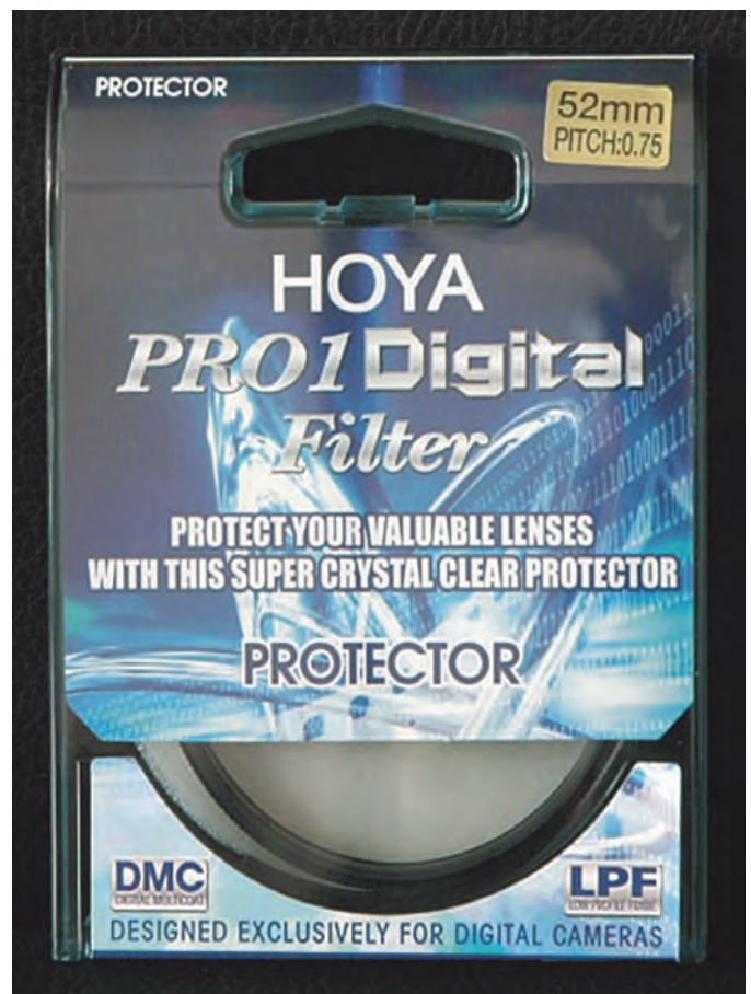
Diverse filterproducenten maken zulke echte protection filters, waaronder deze goede van Hoya.

Reden voor aanschaf is dat ik zowaar een verschil merkte met en zonder UV-filter; bij de standaardlens was het niet merkbaar, maar wel bij mijn supergroothoeklens. Ik had echter toch wel behoefte aan bescherming, vandaar de aanschaf, speciaal voor die lens, van zo'n echte protector.