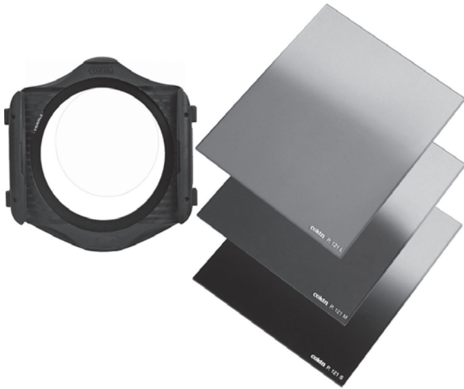
Een kunststof filtersysteem van het merk Cokin, met een goede reputatie.

Verder zijn er kunststof filtersystemen in de handel met een serie grijs- en grijsverloopfilters.