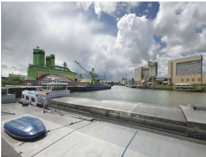
Voorbeeld van een opname met een polarisatiefilter, ingezet voor het verkrijgen van de verzadigde kleuren, met name in de lucht. Hier is een filter van het voordelige Chinese merk GreenL gebruikt.

Op genoemde website zijn polarisatiefilters van dit merk al voor luttele euro's te koop. Zie mijn eerdere artikel over dit onderwerp in de SoftwareBus. Inmiddels wordt dit alleszins fraaie Chinese merk ook verkocht in Nederlandse webwinkels.