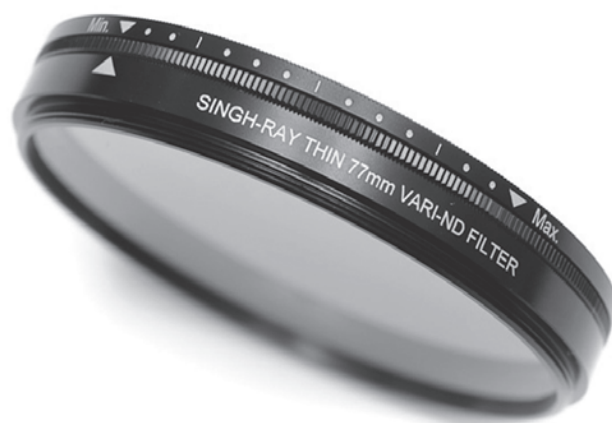
Een variabel ND filter.

Zo'n variabel ND-filter werkt ongeveer hetzelfde als een polarisatiefilter; twee delen glas die ten opzichte van elkaar worden verdraaid, en waarbij gaandeweg het filter donkerder van kleur wordt. Van lichtgrijs tot bijna zwart. Ook hierbij geldt dat zo'n variabel ND-filter dikker is dan een filter met enkel glas; dus oppassen geblazen dat het niet resulteert in vignettering. Een goedkopere variant is een kunststof filtersysteem, met aparte kunststof plaatjes van diverse 'donkerte'.